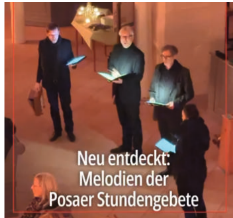
Neujahrskonzert St. Michael