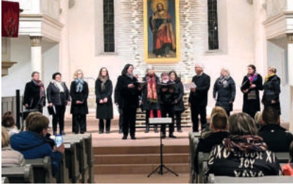
mit Consonanta in Zeitz