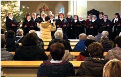
Gemischter Chor Elstertal in Rippicha