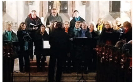
Gospelchor Celebrate in Kretzschau