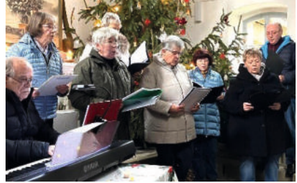
mit Fam. Hofmann in Breitenbach