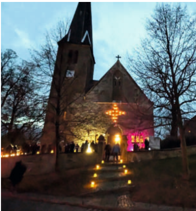
Kirche Kretzschau mit Konzertbeleuchtung